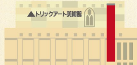
▲トリックアート美術館